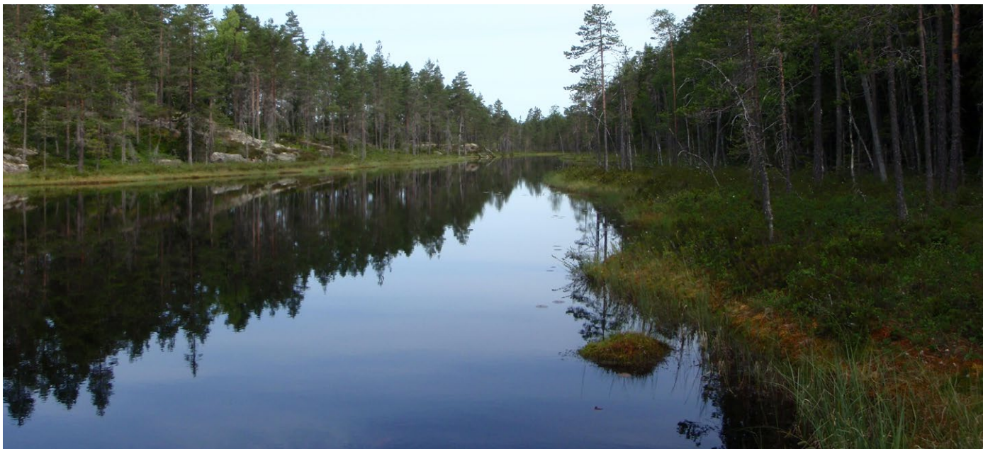
En av Långa tjärnarna i reservatet med samma namn.

Långa tjärnarna är ett stort vildmarksliknande skogsområde. Skogen är gammal och bär spår av skogsbrand och kolvedhuggning. Välkommen på en vandring bland skogstjärnar, granskogar, gamla tallar, lövrika skogar och vackra sjöar.