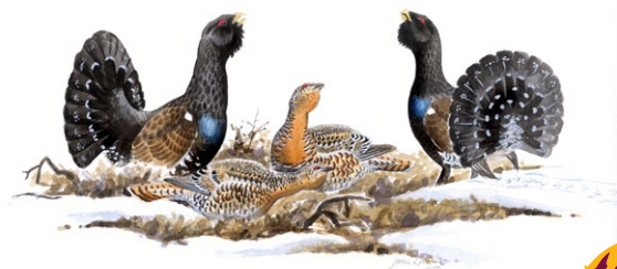
Tjäderspel. Illustration: Jonas Lundin

Är du här tidigt på våren kan du få se tjäderna spela eller kanske höra en pärluggla ropa i skogen. Sommartid kan man se fiskgjusen ryttla över sjöarna. När fågeln ryttlar står den still i luften – flyger på stället. Fiskgjusen lockas av de fiskrika sjöarna och kan flyga långt från boträdet för att nå bra fiskeplatser. Sällsynta växter och lavar i skogen finns inslag av stenblock och branter. Blocken är ibland vackert draperade av mossor och lavar. På några block växer den mycket sällsynta norsk näverlav. En annan ovanlighet som trivs här är violettgrå tagellav. Här kan du även hitta den lilla orkidén knärot, växande i mossan på stenblock eller på marken i granskogen.