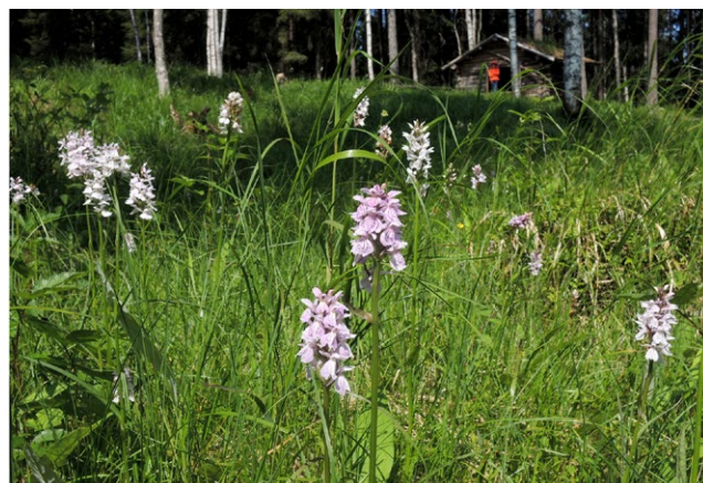
Slättermark med den gamla slätterladan i bakgrunden.

Under 1900-talets början var sluttningarna ner mot Nittälven öppna ängs- och betesmarker med ängslador och gärdesgårdar i. I öster invid älven ligger tallheden som kallas för Mördarheden efter det mord som inträffade här under tidigt 1800-tal.