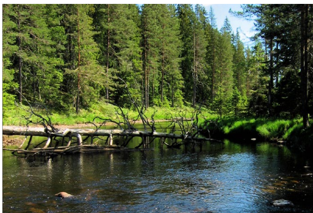
Nittälven vid Mördarheden.